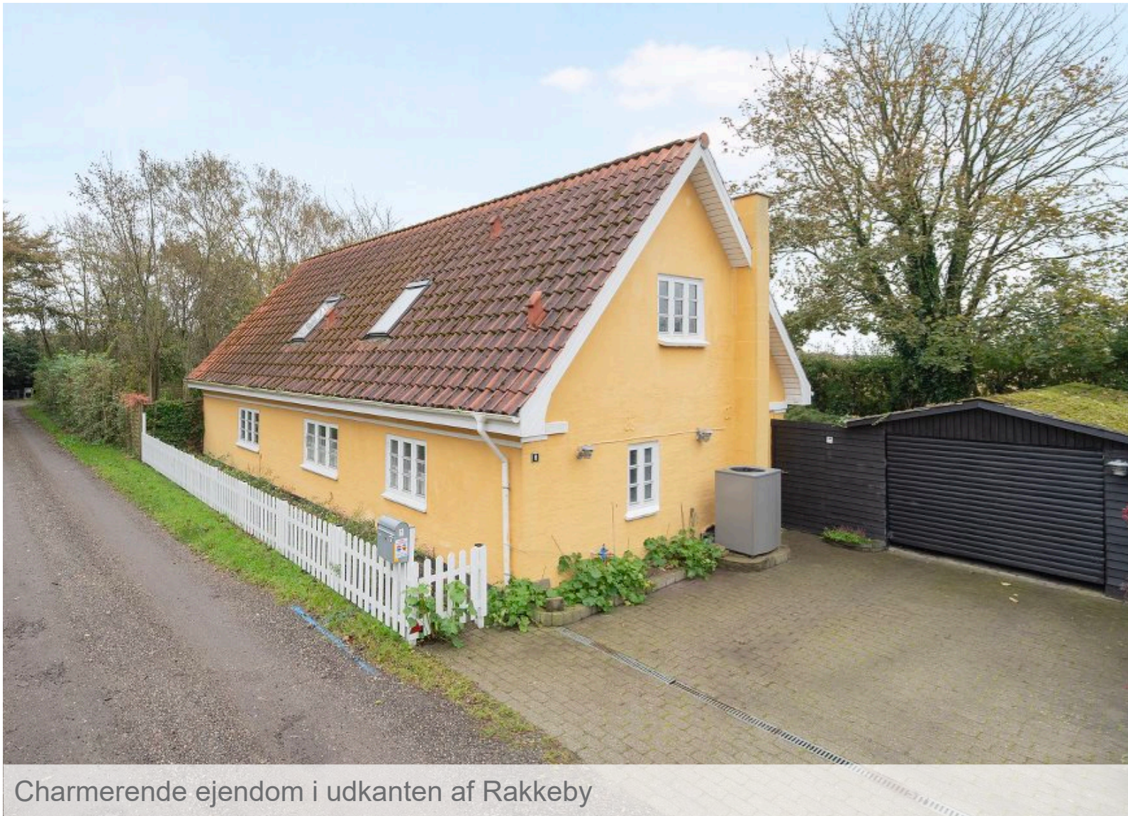
Charmierende ejendom i udkanten af Rakkeby