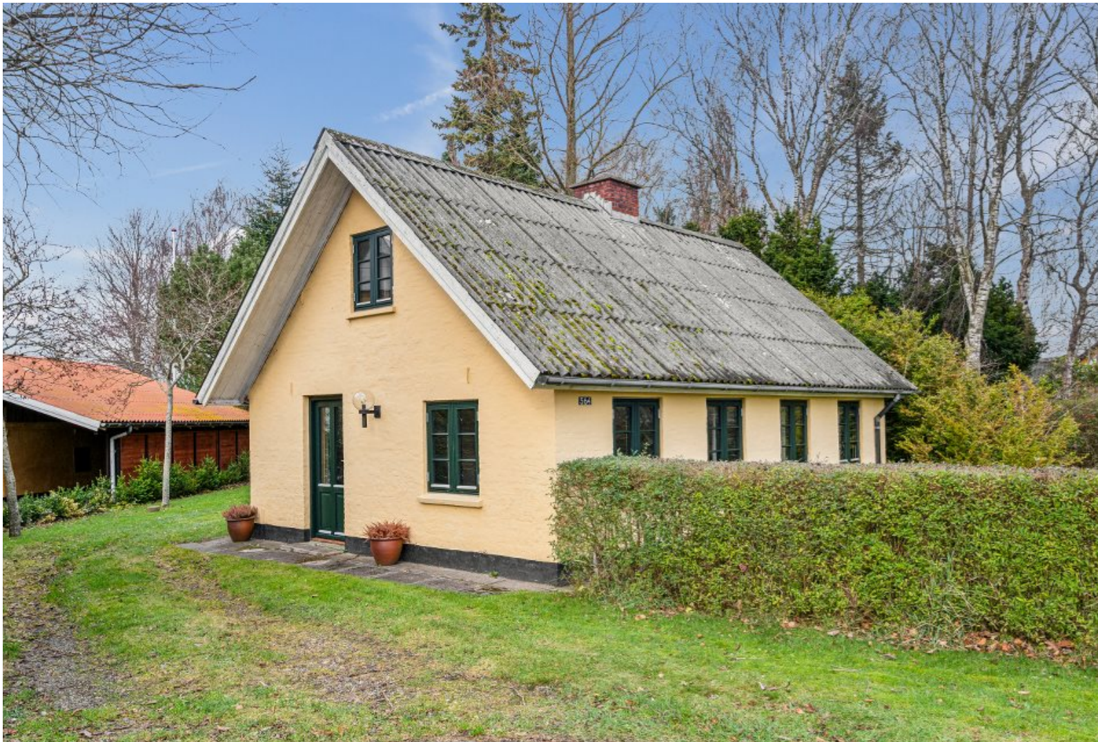
Lille hyggeligt byhus i Flauenskjold

Alborgvej 564 Flauenskjold 9330 Dronninglund