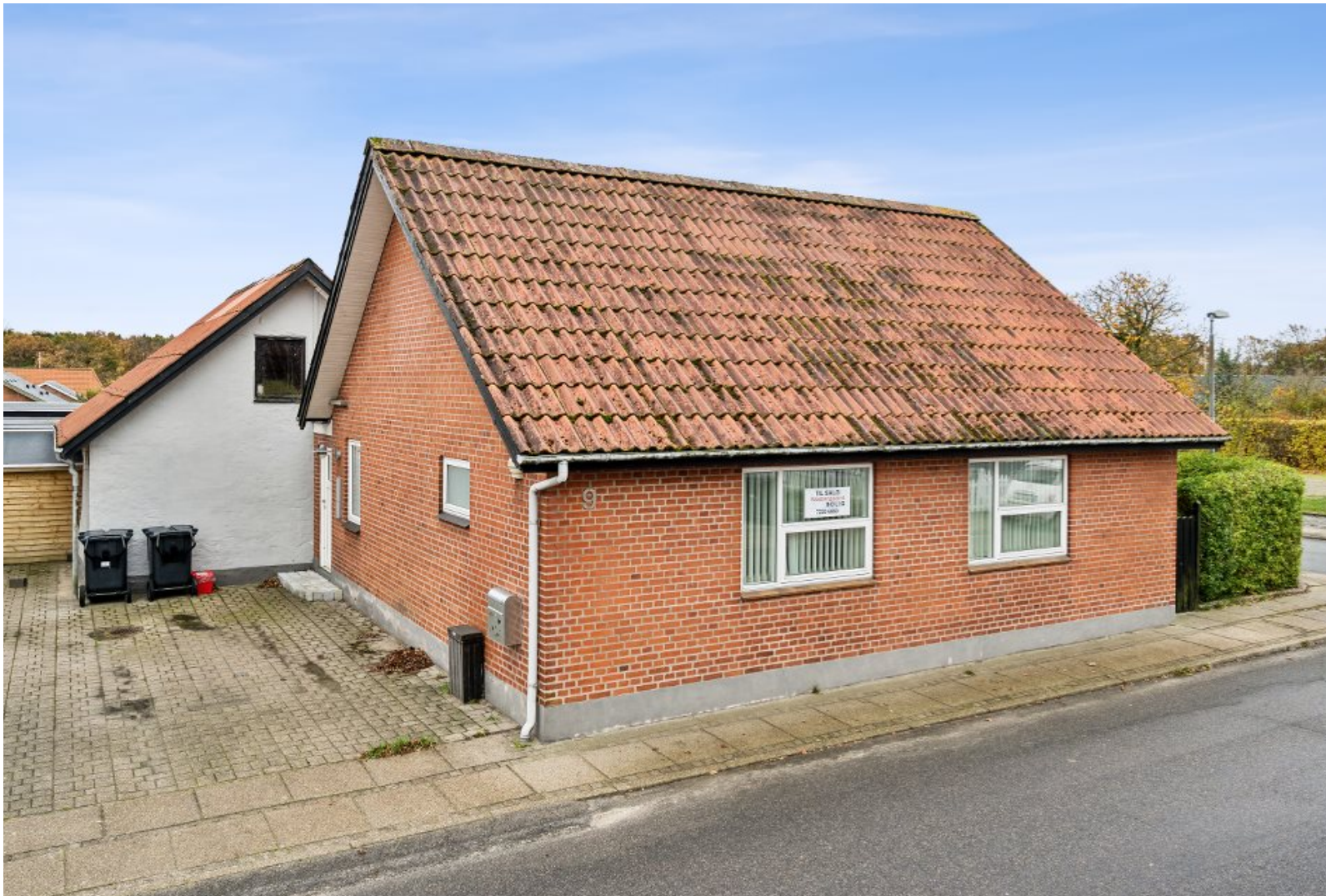
Flot moderniseret hus centralt i Serritslev