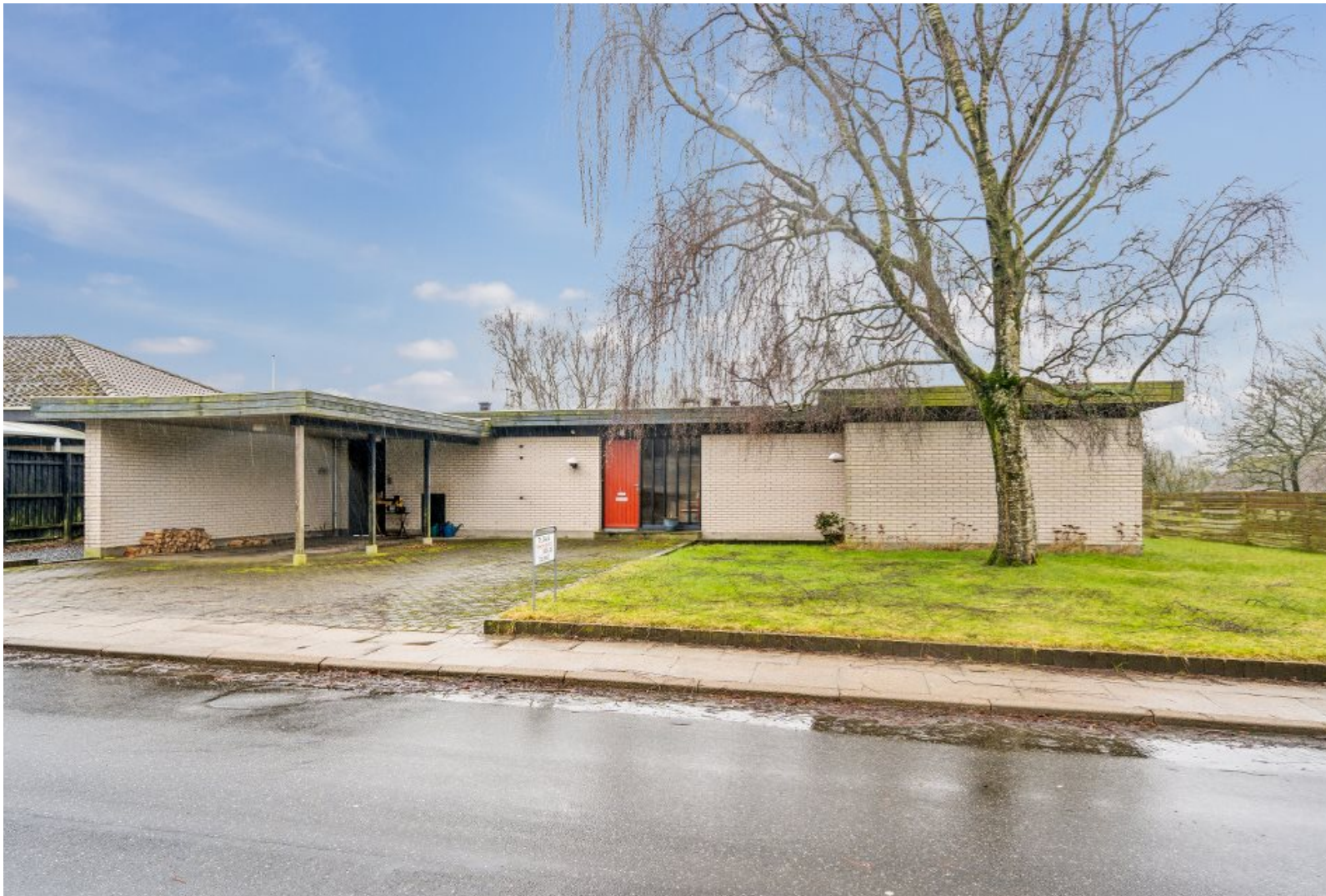
Arkitekttegnet 60ér villa i Jerslev