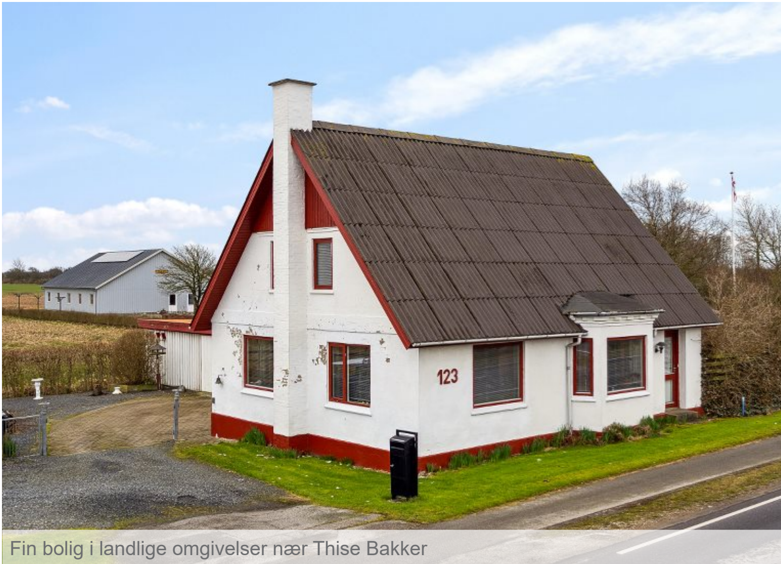
Fin bolig i landlige omgivelser nær Thise Bakker