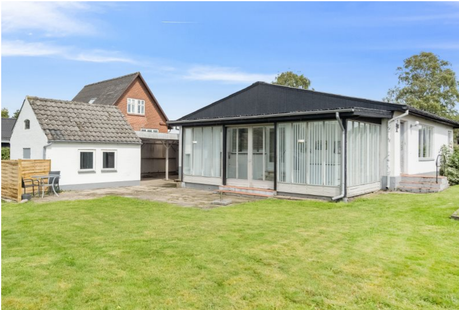
Fint og moderniseret hus i Klokkeholm

Rosenvænget 20 Klokkeholm 9320 Hjallerup