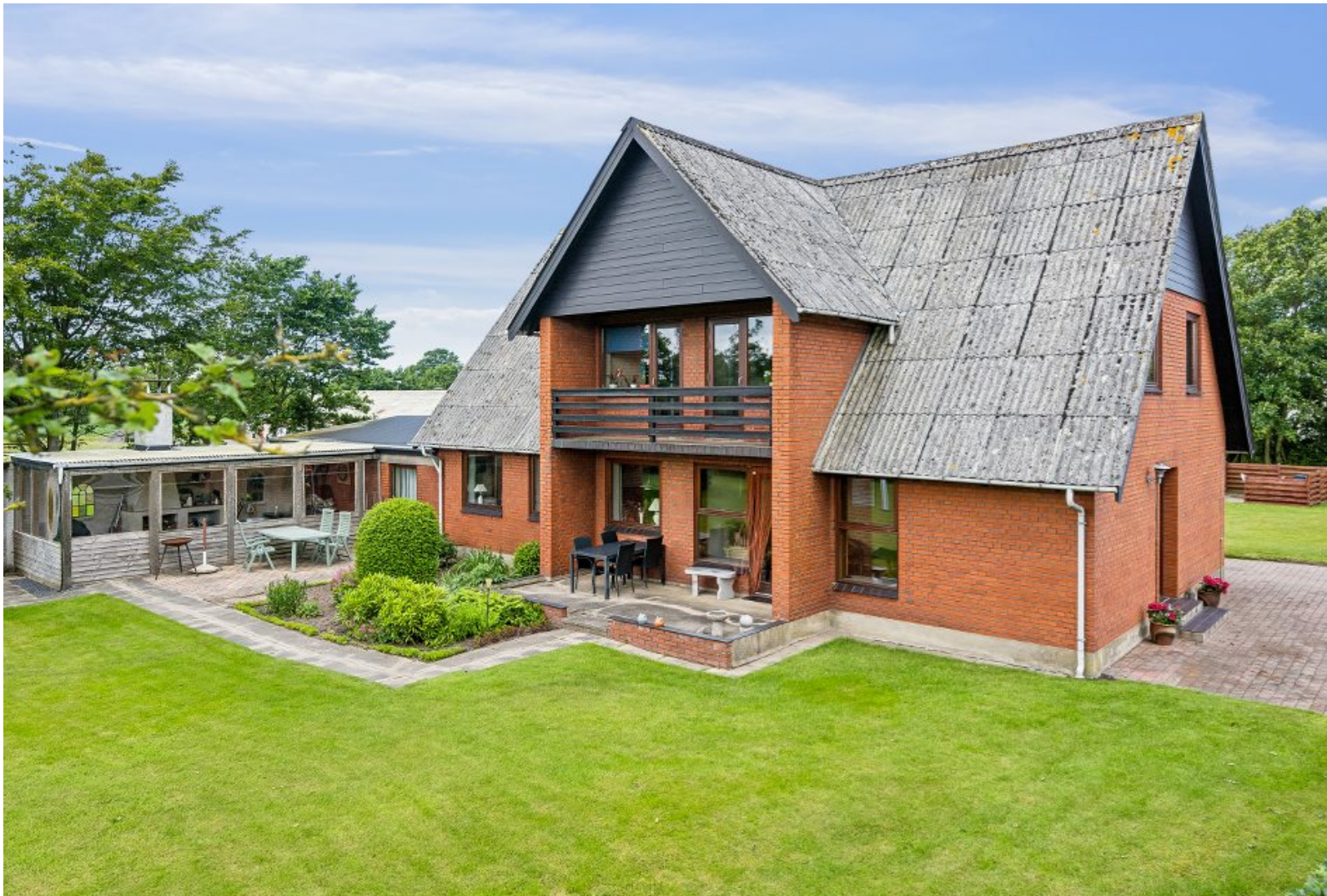
Stor rødstensvilla på naturskøn grund